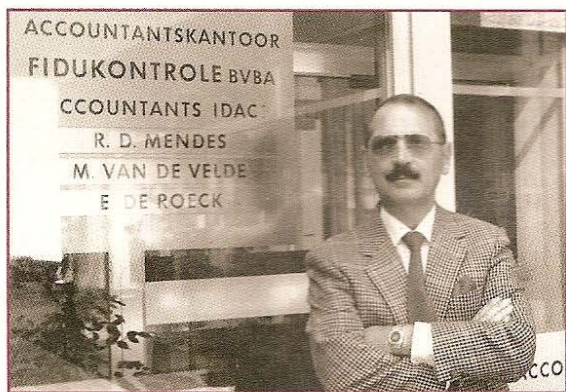
Bob Mendes in een vorig leven, als accountant. Valt de gelijkenis met Hercule Poirot u ook op?